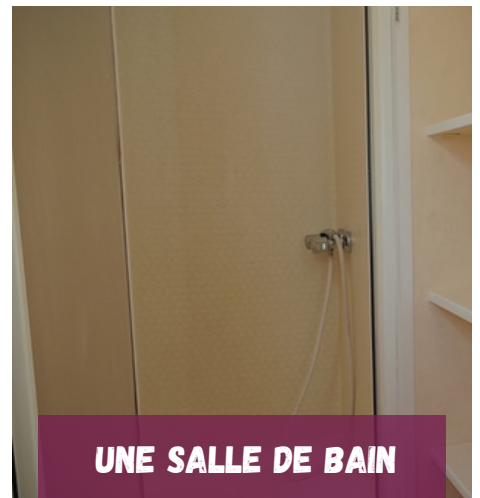
UNE SALLE DE BAIN

Nos locations sont équipées d'une terrasse bois semi-couverte, et d'un salon de jardin permettant de vivre à l'extérieur en toute sécurité.