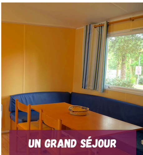
UN GRAND SÉJOUR