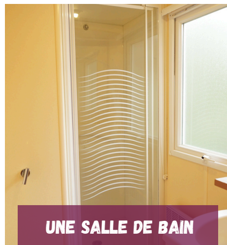
UNE SALLE DE BAIN

Nos locations sont équipées d'une terrasse pavée couverte d'une tonnelle, et d'un salon de jardin permettant de vivre à l'extérieur.