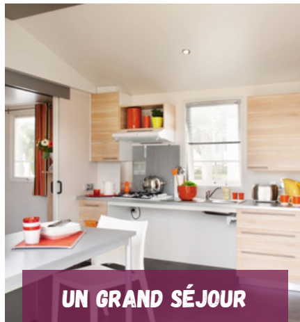
UN GRAND SÉJOUR