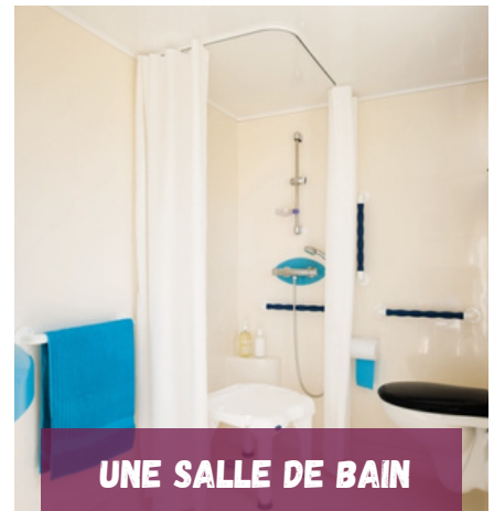
UNE SALLE DE BAIN

Notre location est équipée d'une terrasse bois semi-couverte, et d'un salon de jardin permettant de vivre à l'extérieur.